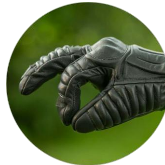
Anatomischer und bequemer Handschuhschnitt