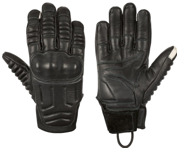
CORA Short Black

Schlagfeste, flammhemmende Handschuhe mit einem außergewöhnlichen anatomischen Schnitt, der hohe Anforderungen an den Schutz vor mechanischen Gefahren und die Absorption möglicher Schläge im Bereich des Handrückens erfüllt. Der Handschuh ist für polizeiliche und militärische Einsätze zur Aufrechterhaltung der öffentlichen Ordnung bestimmt (Einsätze bei Demonstrationen, gegen Randalierer, zur Konfliktverhütung).