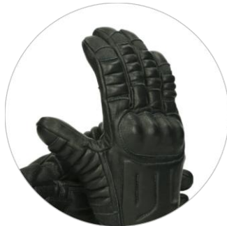
D3O®-Protector der Knöchel auf dem Handrücken