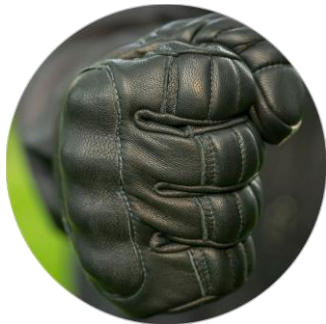
Starke und robuste Handschuhkonstruktion