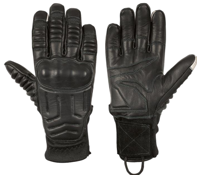
CORA Long Black