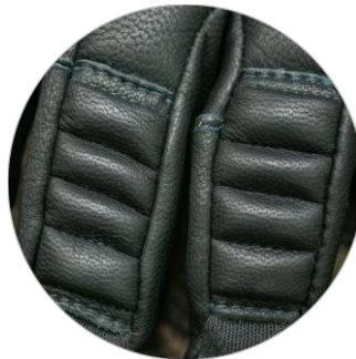
Ziegenlederverstärkung mit stoßdämpfendem PORON® XRD™